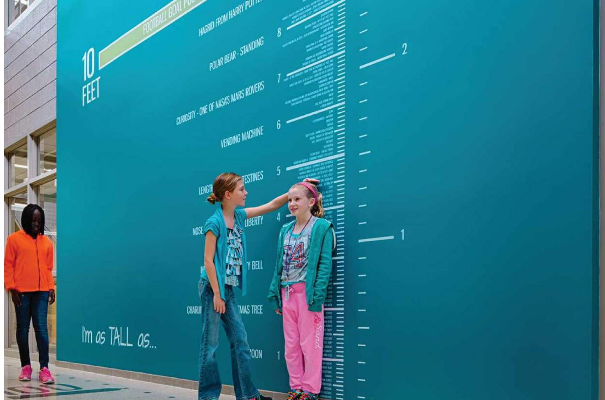
EDIFICIO COMO HERRAMIENTA DE ENSEÑANZA