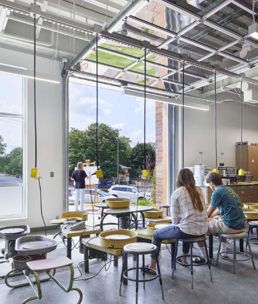
CONEXIÓN AL EXTERIOR